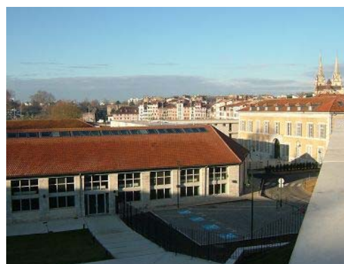
Campus de Bayonne